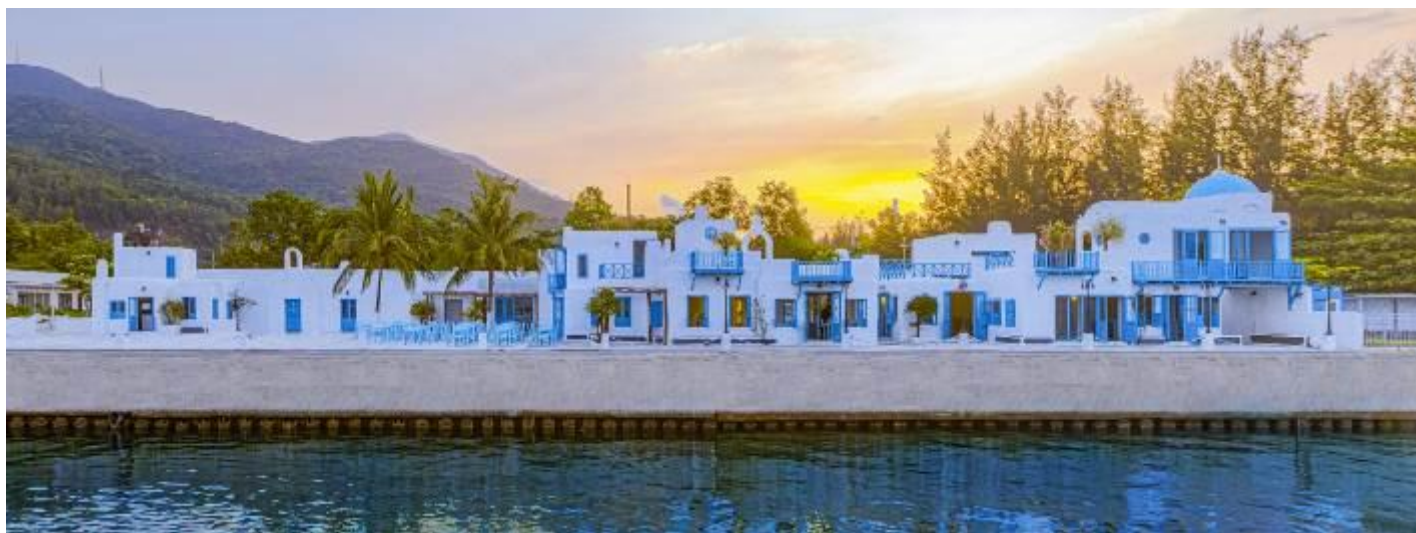
Santorini Vibes มากๆสวยจริงไม่จกตา (ไม่รวมค่าเครื่องดื่ม+อาหาร)

จากนั้นนำท่านเดินทางเข้าสู่คาเฟ่ลับที่ SON TRA MARINA CAFE คาเฟ่ริมทะเลสุดปัง มุมถ่ายรูปสุดชิค สไตล์