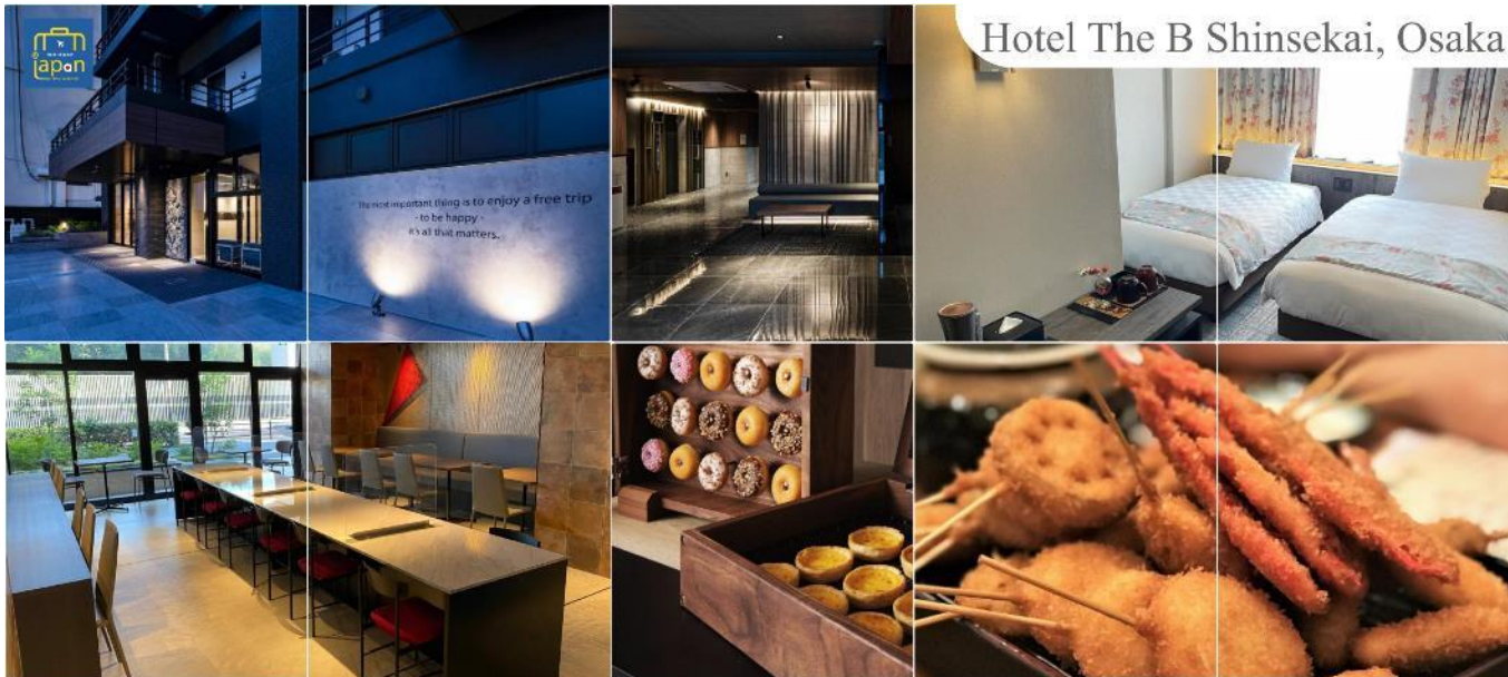
Hotel The B Shinsekai, Osaka

HOTEL THE B SHINSEKAI, OSAKA หรือเทียบเท่าระดับเดียวกัน