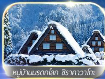
หมู่บ้านมรดกโลก ชิราคาวาโกะ