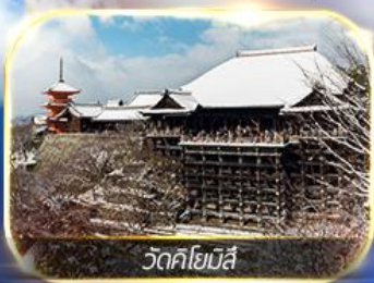
วัดคิโยมิสึ