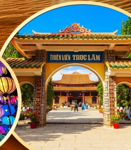
วัดตักลับ