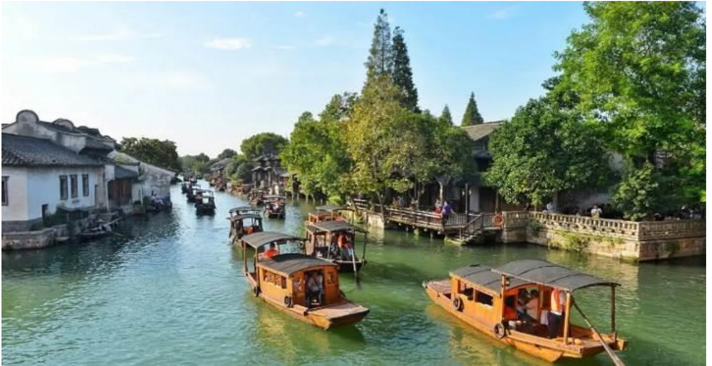
โบราณ และความเป็นโมเดิร์นที่ผสมผสานได้อย่างลงตัว

ความเป็นอยู่ของชาวเมืองอุเจิ้น เมืองที่ได้ชื่อว่า " นครเวนิสแห่งมณฑลเจ้อเจียง" มีประวัติศาสตร์กว่า 1,000 ปี ชมชีวิตความเป็นอยู่ของชาวบ้านริมน้ำ สถานที่ที่บ่งบอกความเป็นเจียงหนันซึ่งเป็นบ้านเกิด "เหมาดุ้น" ชมสิ่งก่อสร้างโบราณสมัยราชวงศ์ หมิงและราชวงศ์แมนจู ที่แห่งนี้ท่านจะได้สัมผัสถึงบรรยากาศความเป็นเมือง