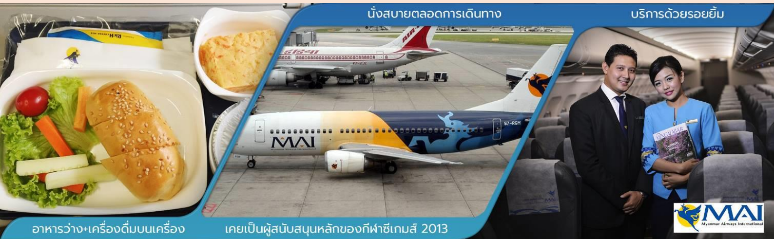
อาหารว่าง+เครื่องดื่มบนเครื่อง

10.40 น. ➔ ออกเดินทางสู่ เมืองย่างกุ้ง โดย เที่ยวบินที่ 8M336