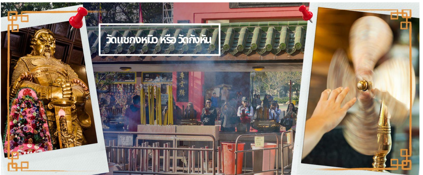
วัดแชกงหมิว หรือ วัดกังหัน

นำท่านเดินทางไป วัดแชกงหมิว หรือ วัดกังหัน (CHE KUNG TEMPLE) วัดแชกงสร้างขึ้นเพื่อเป็นอนุสรณ์เพื่อรำลึกถึงตำนานแห่งนักรบราชวงศ์ซ่ง มีนามว่า “แช กง” แม่ทัพปราบศึก ผู้คนทั่วทุกดินแดนต่างยำเกรงในกำลังพลอันกล้าหาญแข็งแกร่งของแม่ทัพแชกง เป็นวัดเก่าแก่ที่มีความศักดิ์สิทธิ์มาก มีอายุกว่า 300 ปีตั้งอยู่ในเขต SHATIN มีประวัติเล่าต่อกันมาว่า ขณะที่แม่ทัพปราบศึกอยู่นั้น ทุกแคว้นเขตแดนแผ่นดินใหญ่ต่างก็ยำเกรงต่อกำลังพลที่กล้าหาญในกองทัพของท่าน ยามที่ออกรบเพื่อต้านข้าศึกศัตรูทุกทิศทาง ทุก ๆ ครั้ง ท่านใช้สัญลักษณ์รูปกังหัน 4 ใบพัดติดไว้ด้านหลังรถศึกนำขบวนในกองทัพ เหล่าทหารกล้ามีความเชื่อว่าเมื่อพก พาสัญลักษณ์รูปกังหันนี้ไป ณ ที่ใด ๆ กังหันนี้จะช่วยเสริมสิริมงคล นำพาแต่ความโชคดี มีอำนาจเข้มแข็ง เสริมกำลังใจให้แก่กองทัพของท่าน ชื่อเสียงในการนำทัพสู้ศึกของท่านจึงเป็นตำนานมาจนทุกวันนี้ ปัจจุบันวัดแชกง จึงเป็นสถานที่สักการะเคารพ ขอพร ท่านแชกง โดยมีสัญลักษณ์เป็นกังหันนำโชคนั่นเอง ☺ การหมุนกังหันนำโชคที่ตั้งอยู่ในวัด เพื่อจะได้หมุนเวียนชีวิตของเราและครอบครัวให้มีความเจริญก้าวหน้าด้านหน้าที่การงาน โชคลาภ ยศศักดิ์ และถ้าหากคนที่ดวงไม่ดีมีเคราะห์ร้ายก็ถือว่าเป็นการช่วยหมุนปัดเป่าเอาสิ่งร้ายและไม่ดีออกไปให้หมด ในองค์กังหันนำโชคมี 4 ใบพัด คือพร 4 ประการ ได้แก่ สุขภาพร่างกายแข็งแรง, เดินทางปลอดภัย, สมความปรารถนา และเงินทองไหลมาเทมา ในทุกๆวันที่ 2 ของเดือนแรกตามปฏิทินจีนชาวฮ่องกงและนักธุรกิจจะมาวัดนี้เพื่อถวายกังหันลมเพราะเชื่อว่ากังหันจะช่วยพัดพาสิ่งชั่วร้ายและโรคภัยไข้เจ็บออกไปจากตัวและนำพาแต่ความโชคดีเข้ามาแทน