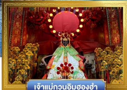
เจ้าแม่กวนอิมฮ่องฮ่า