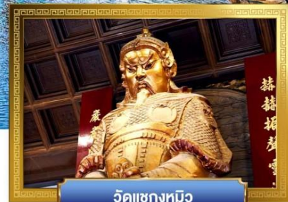
วัดเขangkหมิว