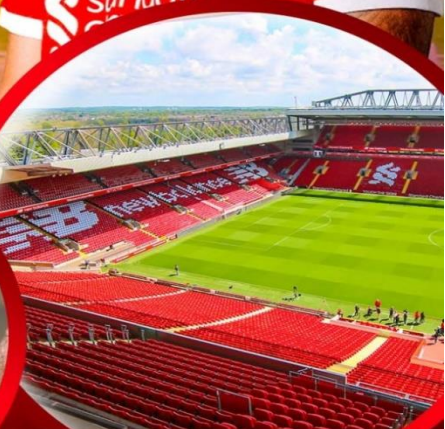
เข้าชมสนามแอนฟิลด์

พิเศษ เข้าชมสนามกีฬาแอนฟิลด์ (ANFIELD STADIUM)