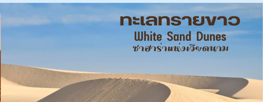
ทะเลทรายขาว White Sand Dunes ซาฮาร่าแห่งเวียดนาม