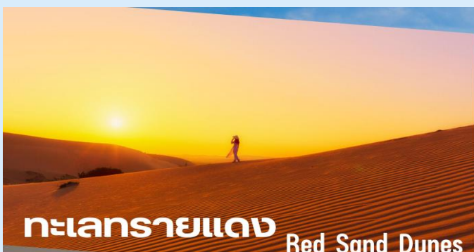
ทะเลทรายแดง Red Sand Dunes

นำท่านชมความงดงามของ ทะเลทรายแดง (Red Sand Dunes) สถานที่ท่องเที่ยวที่มีชื่อเสียงมากและอยู่ใกล้ชายทะเลเม็ดทรายละเอียดสีแดงละเอียดราวกับแป้ง เนินทรายจะเปลี่ยนรูปร่างไปตามแรงลมที่พัดผ่านมา อีสรระกับการถ่ายภาพ จากนั้นชมและสัมผัสความยิ่งใหญ่ของเม็ดทรายละเอียดสีขาว ทะเลทรายขาว (White Sand Dunes) หรือที่เรียกว่าทะเลทรายขาวทะเลทรายที่ใหญ่ที่สุดของเวียดนามหรือ ซาฮาร่าแห่งเวียดนาม (ไม่รวมรถจี๊ปเที่ยวชมทะเลทราย คันละ 1,000 บาท นั่งได้ 5-6 ท่าน/คัน)