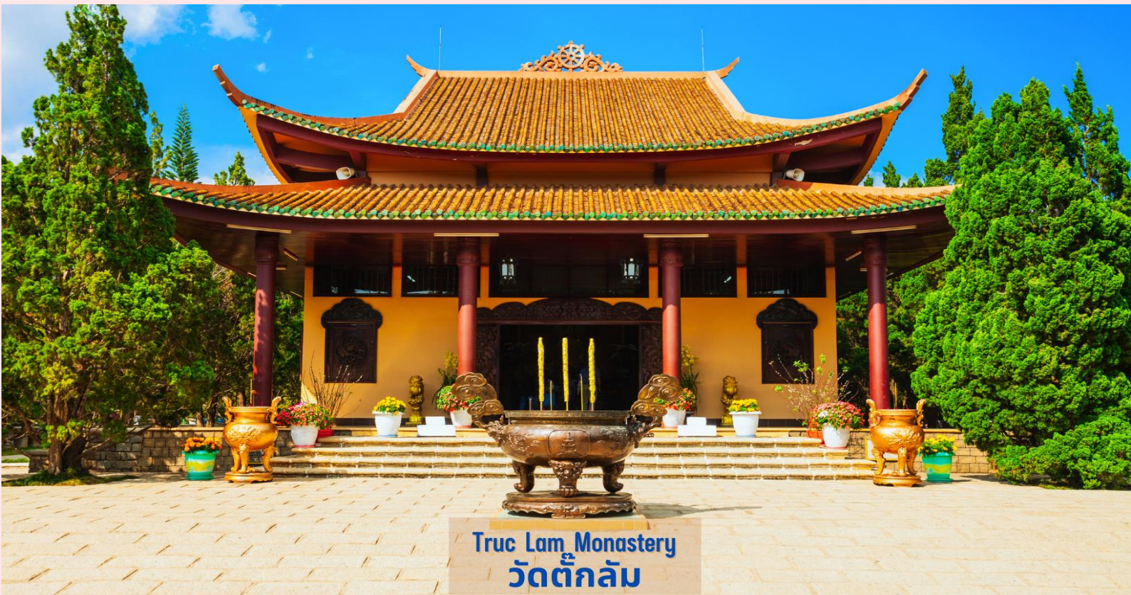
Truc Lam Monastery วัดตึกลัม

นำท่านสัมผัสประสบการณ์สุดตื่นเต้นโดยการ นั่งรถราง (Roller Coaster) ผ่านผืนป่าอันร่มรื่นเขียวชอุ่มลงสู่หุบเขา เบื้องล่าง เพื่อชมและสัมผัสกับความสวยงามของ น้ำตกดาตันลา (Datanla Waterfall) อยู่ห่างจากตัวเมืองดาลัดไปทางทิศใต้ประมาณ 5 กิโลเมตร เป็นน้ำตกไม่ใหญ่มากแต่มีความสวยงาม น้ำตกแห่งนี้จะเป็นน้ำตกที่มีนักท่องเที่ยวมาเยือนมากที่สุดและไม่ควรพลาดในการมาเที่ยวชม (ราคาทัวร์รวมบริการนั่งรถรางโรลเลอร์โคสเตอร์ไป-กลับแล้ว)