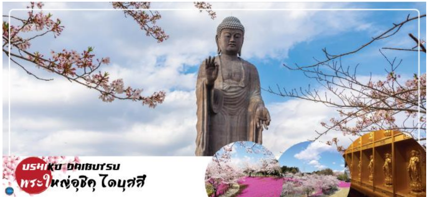
USHIKU DAIBUTSU พระใหญ่อุซึกุ ไดบุตสึ

นำท่านนมัสการ พระใหญ่อุซึกุ ไดบุตสึ (Ushiku Daibutsu) (ใช้เวลาเดินทางประมาณ 50 นาที) เป็นพระพุทธรูปปางยืนที่สูงที่สุดของประเทศญี่ปุ่น และเคยเป็นรูปปั้นที่สูงที่สุดในโลกที่ถูกบันทึกไว้ โดยหนังสือบันทึกสถิติโลกกินเนสส์บุ๊ก (Guinness Book of world records) เมื่อปี ค.ศ. 1995 ด้วย ความสูงถึง 120 เมตร ทำให้สามารถมองเห็นได้ตั้งแต่ใจกลางเมืองโตเกียวเลยทีเดียว สามารถเข้าไปยังบริเวณภายในรูปปั้นและขึ้นไปยังจุดที่เป็นหอสังเกตการณ์ในระดับความสูงที่ 85 เมตร ซึ่งจะอยู่ตรงส่วนของหน้าอกพระพุทธรูป เป็นจุดที่สามารถมองเห็นวิวในมุมด้านกว้างได้ ทั้งหมด บนชั้นนี้ จะมีกระจกที่เป็นช่องหน้าต่างอยู่ด้วยกัน 4 ด้าน และมองเห็นภูเขาไฟฟูจิได้จากตรงนี้อีกด้วย (ราคาไม่รวมค่าเข้าพระพุทธรูปด้านใน) บริเวณใกล้เคียงจะมีสวนขนาดใหญ่เนื่องจากต้นไม้ในสวนส่วนมากเป็นต้นซากุระ ในช่วงที่ซากุระบานที่นี่จึงสวยงามเป็นพิเศษ เรียกได้ว่ามาไหว้พระอย่างเดียวก้อมบุญแล้ว แถมยังได้อึ้งใจไปกับวิวสวยๆอีกด้วย (จัดชมซากุระขึ้นกับภูมิภาค) (ราคาไม่รวมค่าเข้าชมสวน) นำท่านเดินทางสู่ เมืองนาริตะ (ใช้เวลาเดินทางประมาณ 40 นาที)