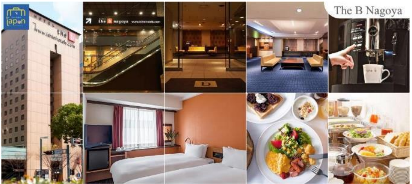
พักที่ HOTEL THE B NAGOYA หรือเทียบเท่าระดับเดียวกัน

หลังเช็กอินเข้าโรงแรม อีสาระให้ท่านเดินเล่นช้อปปิ้ง ย่านซาคาเอะ (Sakae) เป็นย่านธุรกิจ การค้า โดยเฉพาะแหล่งราตรี เช่น คลับและบาร์ มีห้างสรรพสินค้ามัตสึซากาเอะ หรือ เมืองใต้ดิน (Central Park) แหล่งรวมแฟชั่นและร้านค้าสุดเก๋มากมาย เช่น ร้านเสื้อผ้า, ร้านของใช้ กระจุกกระจิก, ร้านชาลอนความงาม เป็นต้น แฟชั่นไฮโดลญี่ปุ่น ห้ามพลาด ต้องมาเยือน ห้างสรรพสินค้าชั้นไฮโซ ซาคาเอะ ซึ่งเป็นจุดศูนย์กลางแหล่งรวมความบันเทิงมากมาย ที่มี Grand Canyon ฮอลล์จัดคอนเสิร์ตศิลปินไอดอลและยังเป็นคาเฟ่ นอกจากนี้ที่นี่ยังเป็นสถานที่ตั้งของ "ชิงช้า สวรรค์ Sky Boat" แลนด์มาร์คของย่านนี้อีกด้วย อีสระเพลิดเพลินย่านนี้ตามอัธยาศัย