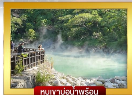
หุบเขาน้ำพุร้อน