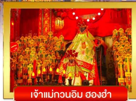
เจ้าแม่กวนอิม สองอำเภอ