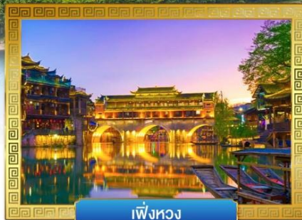
เฟิ่งหวง