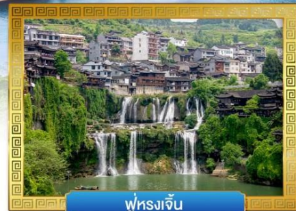
ฟูหลงเจิน