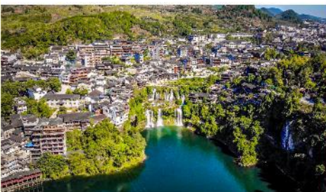
ผูหรงเจิน