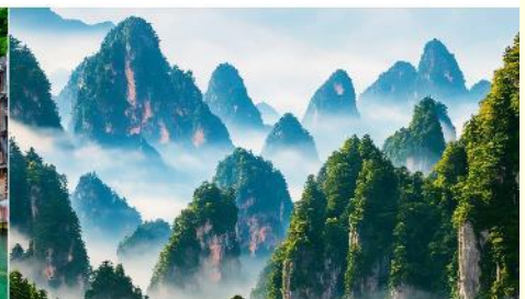
เขาเทียนชื้อซาน

*ทางบริษัทฯ ขอสงวนสิทธิ์ในการสลับโปรแกรมทัวร์ตามความเหมาะสมขึ้นอยู่กับสถานการณ์หน้างาน โดยคำนึงถึงผลประโยชน์ของลูกค้าเป็นสำคัญ