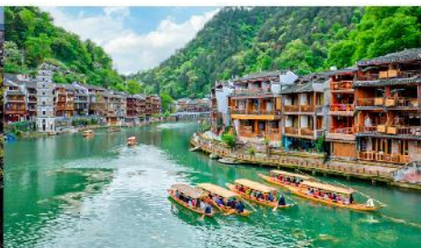
เมืองเฟิ่งหวง