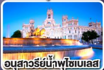
อนุสาวรีย์น้ำพุไซเบเลส