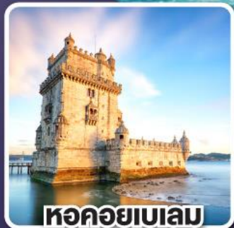
หอคอยเบเลม

ชมโชว์ ระบาย ฟลามิงโก ศิลปะระบายพื้นเมืองในสเปน