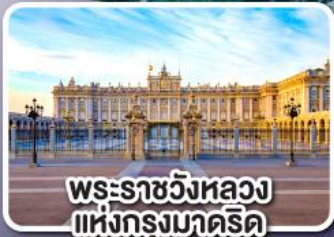
พระราชวังหลวง แห่งกรุงมาดริด