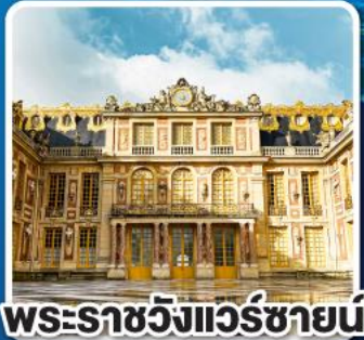
พระราชวังแวร์ซายน์