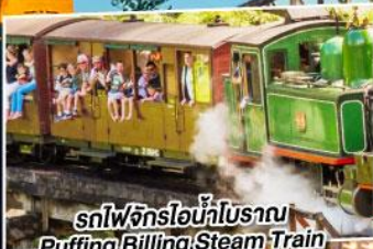
รถไฟจักรไอน้ำโบราณ Puffing Billing Steam Train