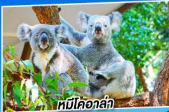
หมีโคอาล่า