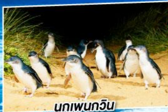
นกเพนกวิน