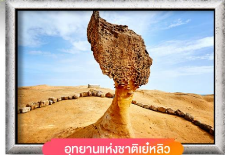
อุทยานแห่งชาติเย่หลิว

เมนู สุดพิเศษ !! เสี่ยวหลงเปา, ปลาประจานาธิบดี, ซาบูบุฟเฟต์สไตล์ไต้หวัน