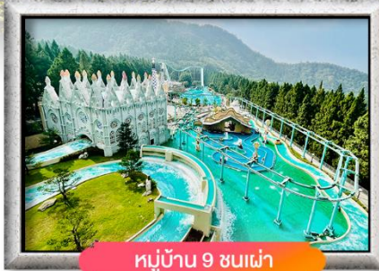
หมู่บ้าน 9 ชนเผ่า