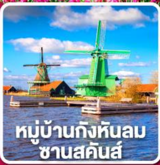
หมู่บ้านกังหันลม ซานสคินส์

เข้าชมเทศกาล สวนดอกไม้เคอเคนฮอฟ 1 ปีมีครั้งเดียว