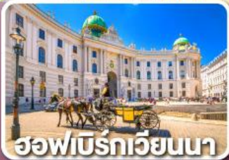
ฮอฟบิรทเวียนนา