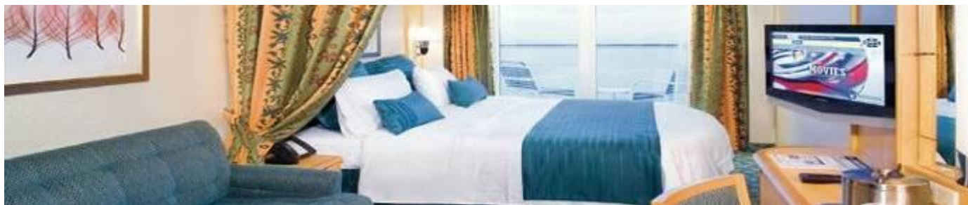
ห้องพักมีระเบียงวิวสวน (Central Park View with Balcony)