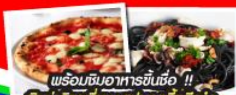
พร้อมชิมอาหารขึ้นชื่อ !! พิซซ่าอิตาลีเส้น+สปาเกตตีหมักดำ